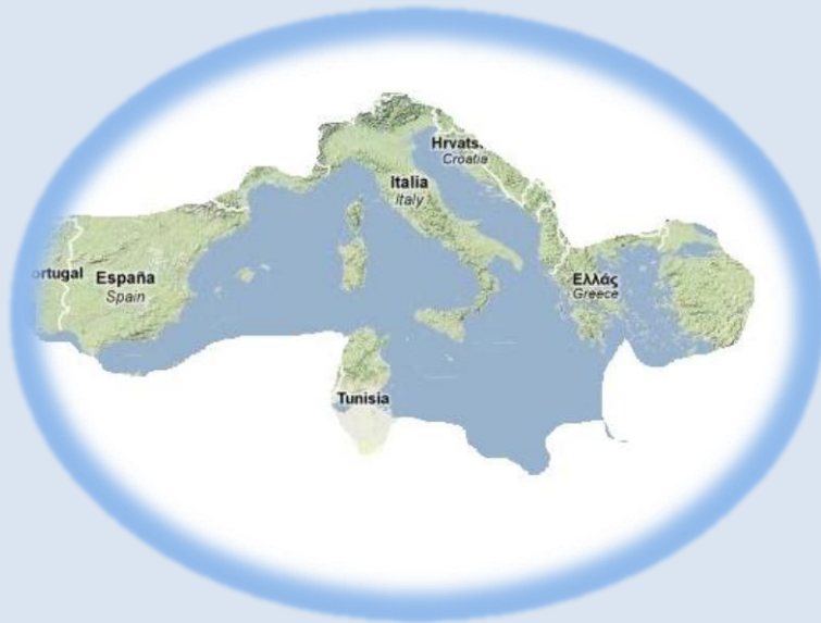
Figura 1 I confini (approssimativi) dell'impero romano al termine delle guerre puniche. Immagine rielaborata da google maps

Alla fine delle guerre puniche, Roma si trovava ad essere padrona di un impero.